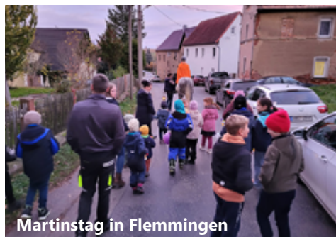
Martinstag in Flemmingen