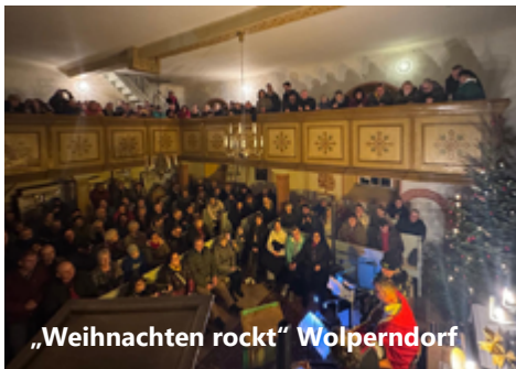
„Weihnachten rockt“ Wolperndorf