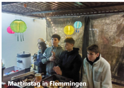
Martinstag in Flemmingen