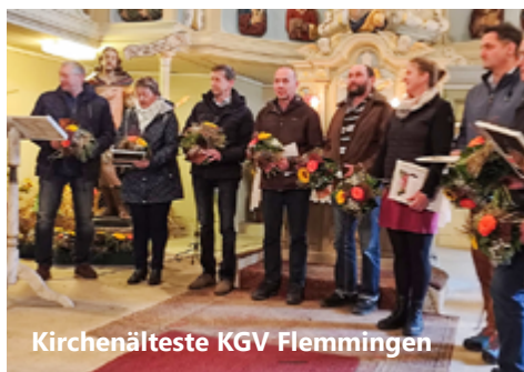
Kirchenälteste KGV Flemmingen