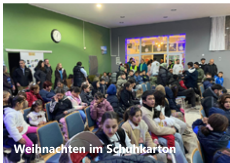
Weihnachten im Schuhkarton