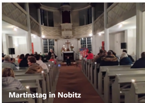
Martinstag in Nobitz