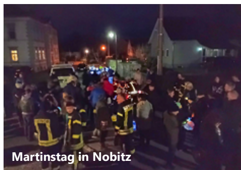
Martinstag in Nobitz