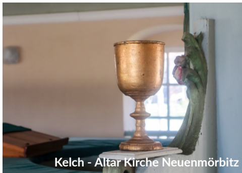
Kelch - Altar Kirche Neuenmörbitz