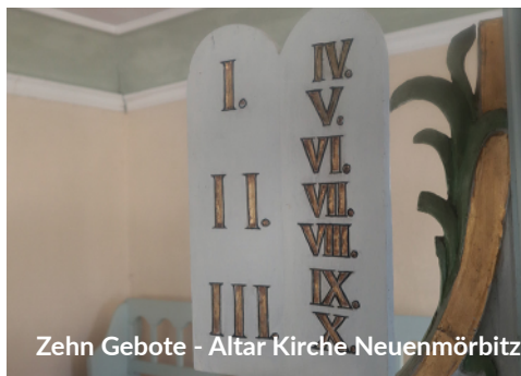
Zehn Gebote - Altar Kirche Neuenmörbitz