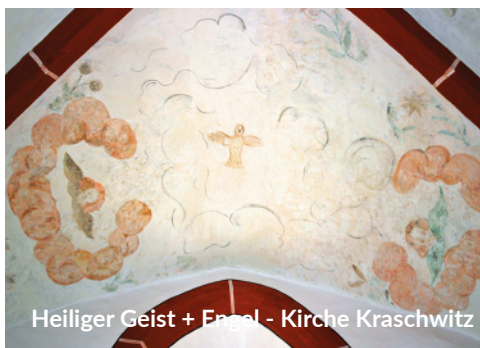
Heiliger Geist + Engel - Kirche Kraschwitz