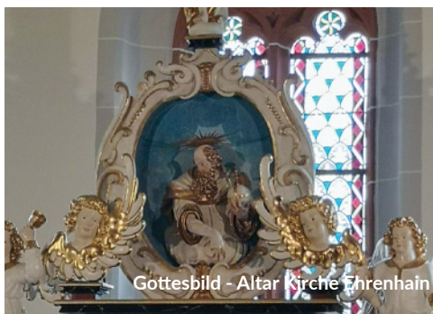
Gottesbild - Altar Kirche Ehrenhain