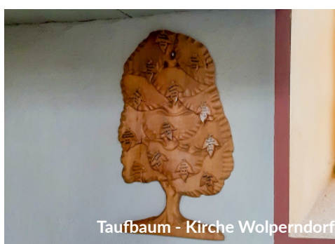
Taufbaum - Kirche Wolperndorf