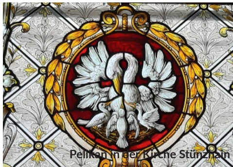
Pelikan in der Kirche Stünzshain