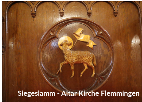
Siegeslamm - Altar Kirche Flemmingen