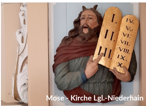
Mose - Kirche Lgl.-Niederhain